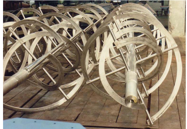
Espirales de ME-500 construidas en acero inoxidable, pulido espejo

La construcción del cuerpo de la máquina en forma de artesa evita la existencia de zonas muertas donde el producto pueda acumularse sin mezclar, garantizando así la mezcla de todo el producto contenido.