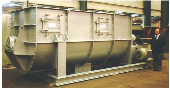
Mezcladora ME-800 de 8.000 l de capacidad construida en acero al carbono

Si a esto unimos la alta rigidez torsional del eje y los soportes de rodamientos alejados del cuerpo de la máquina, obtenemos un equipo con un bajo número de averías y una muy larga vida útil de funcionamiento.