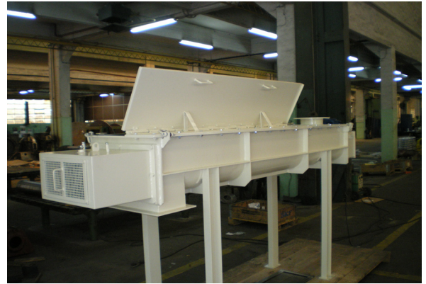
Mezcladora de Palas modelo MPD-2000

La construcción del cuerpo de la máquina en forma de artesa evita la existencia de zonas muertas donde el producto pueda acumularse sin mezclar, garantizando así la mezcla de todo el producto contenido.