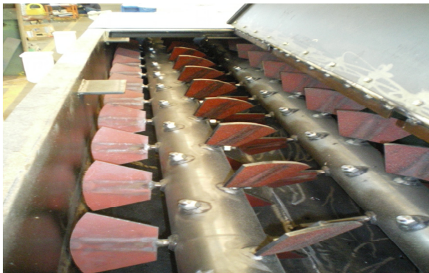
Doble eje de la Mezcladora modelo MPD-4000

Destacan en estas máquinas su construcción sencilla y funcional , pensada para dotar al equipo de un funcionamiento estable y una larga vida útil de funcionamiento sin ajustes y prácticamente libre de mantenimiento .