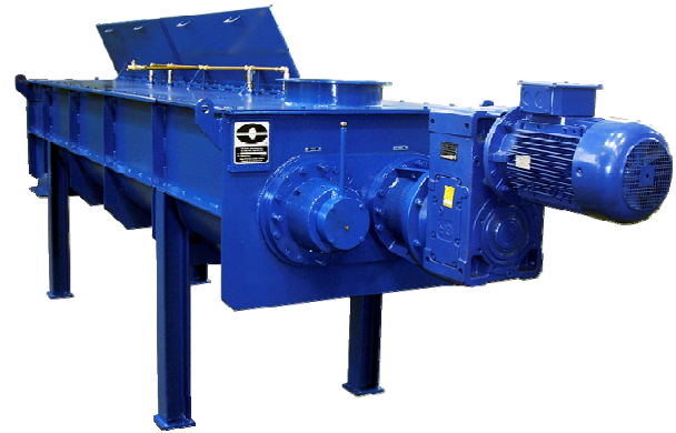
Mezcladora MPD-4.000 construida en acero al carbono

Si a esto unimos la alta rigidez torsional de los ejes y los soportes de rodamientos alejados del cuerpo de la máquina, obtenemos un equipo con un bajo número de averías y una muy larga vida útil de funcionamiento.