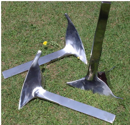
Palas de arado construidas en acero inoxidable, acabado pulido espejo

Un apartado muy importante es la seguridad . Las mezcladoras de alta turbulencia fabricadas por GRUBER HERMANOS S. A. disponen de sistema de doble seguridad , que evita que el operario acceda al interior de la máquina, mientras el motor de accionamiento está en funcionamiento.