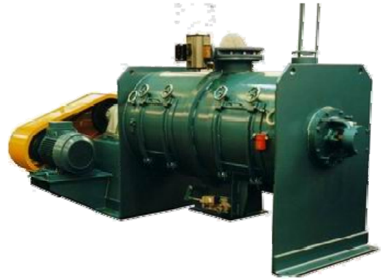
Mezcladora MT-200 de 2.000 l de capacidad construida en acero al carbono

Si a esto unimos la alta rigidez torsional del eje y los soportes de rodamientos alejados del cuerpo de la máquina, obtenemos un equipo con un bajo número de averías y una muy larga vida útil de funcionamiento.